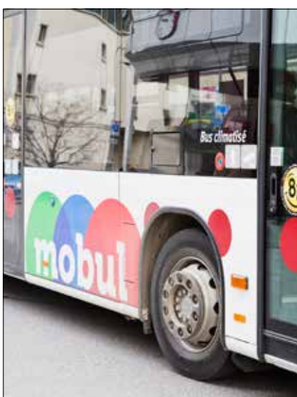
ARCH - R. GAPANY

TPF. L'horaire 2018, valable dès le 10 décembre, prévoit d'importantes améliorations en Gruyère, Glâne et Veveysse. Les lignes régionales de bus profiteront pleinement du retour, à Romont et à Palézieux, du Lucerne-Genève Aéroport des CFF. PAGE 3